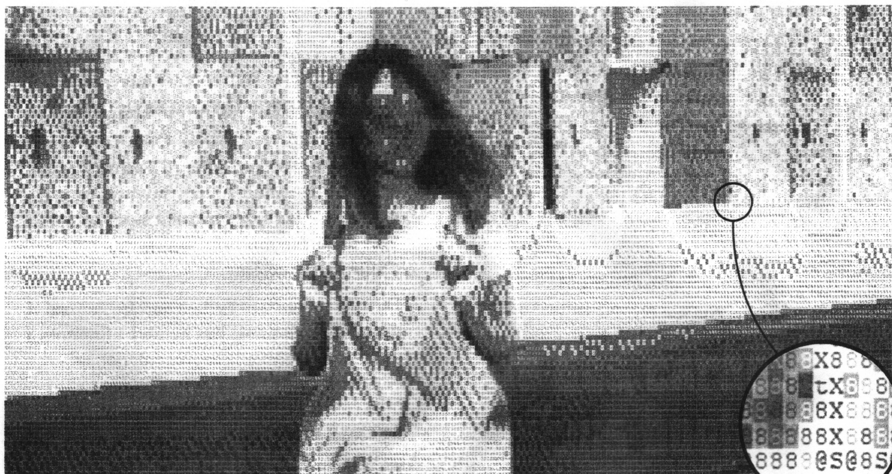
ASCII art : visuel réalisé uniquement avec des caractères ASCII.